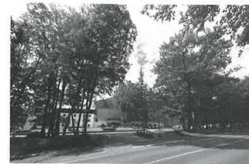
アルプスの山々を貫く立山・黒部アルペンルートの入口に位置するANAホリデイ・インリゾート信濃大町くろよん。北アルプスの雄大な自然に囲まれて立地する。

住所：長野県大町市平2020 HP：https://kuroyon.holidayinnresorts.com/ 開業：2020年7月1日（リブランドオープン） 所有：関電不動産開発(株) 経営：(株)関電アメニックス 運営：IHG・ANA ホテルズグループジャパン 延床面積：1万3349.9m 2 建築面積：6173.96m 2 客室数：73室 主な付帯施設：レストラン、ラウンジ、宴会場、リゾートセンター、キッズクラブ、フィットネスセンター、温泉浴場、プール 他