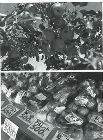
上/峯村農園での「リンゴ収穫体験」は人気のアクティビティ。標高750mに位置し、北アルプスから湧き出る水で育った完熟リンゴは糖度が高い。下/10種類を超えるリンゴの他、洋ナシや和ナシを栽培。店頭で販売しており、農産物加工所を併設し、ジュースや各種ジャムなども扱う。

「Wicky（キッキ・ウィッキー）」がいる。キッキ・ウィッキーは北アルプスの大自然で生まれ、同ホテルのお手伝いをしながら暮らしているという。運がよければ、館内で出会うこともある。 黒部ダム見学の迎賓館的な位置付けだった旧ホテル。そうした歴史は継承しつつ、リゾートに伴い館内の改装を行なった。暖炉をメインにした山小屋風のロビーラウンジを設け、リゾートセンターやキッズクラブなどを整備。客室はホリデイ・インのスタンダードに合わせてベッドなどを入れ替え、内装を一新した。様変わりしたホテルだが、今でも旧ホテル時代の顧客や黒部ダム見学の企業関係者の利用が少なくない。そうした宿泊客の多くが、次は子どもや孫とともに家族連れでやっ