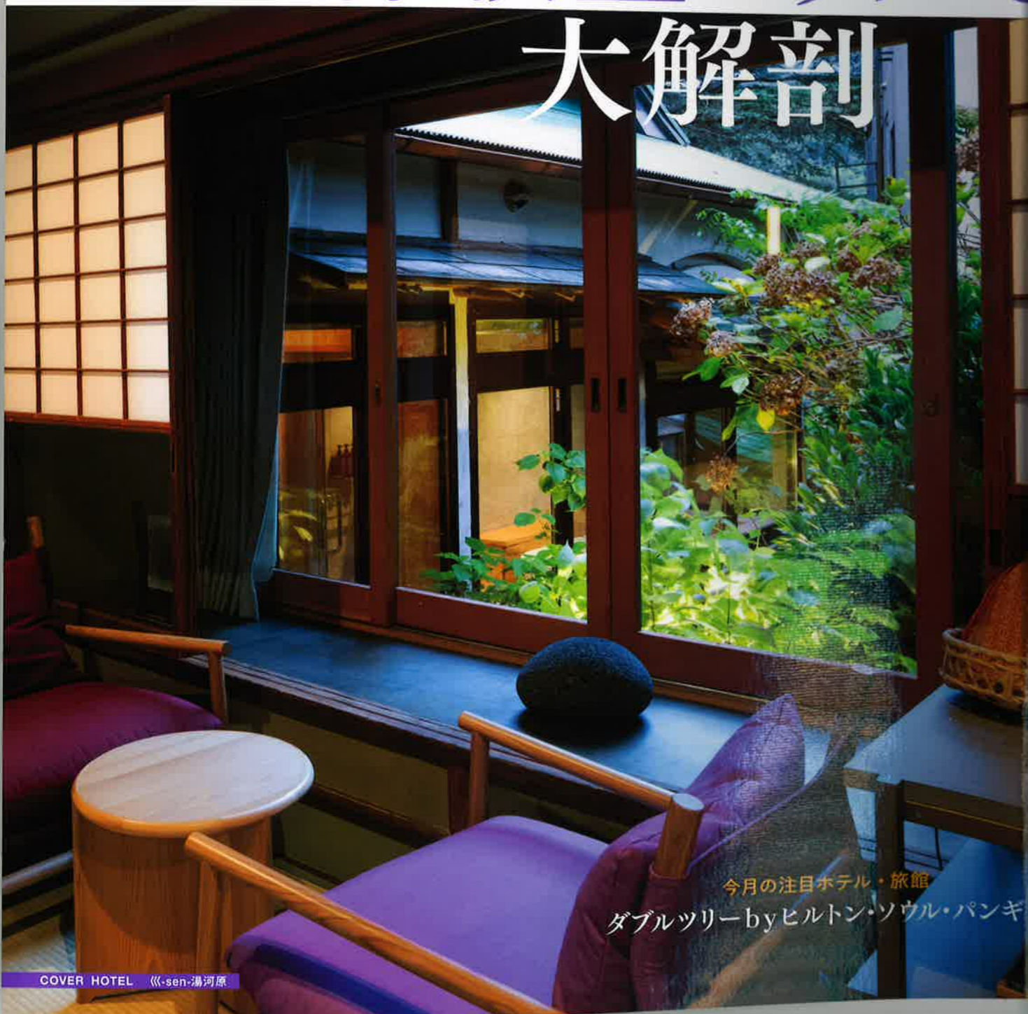
今月の注目ホテル・旅館 ダブルツリー by ヒルトン・ソウル・パンキ